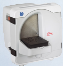
MT3 Marathon Squadramodelli ad acqua Art. No. 1808 0500