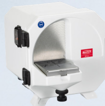
MT plus Marathon Squadramodelli ad acqua e a secco Art. No. 1803 0500