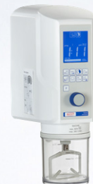
Twister evolution Miscelatore sotto vuoto incl. tazza da 500 ml e agitatore Art. No. 1828 0000