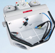
Basic quattro Micro-sabbatrice 25-70 µm/70-250 µm Art. No. 2958 0000