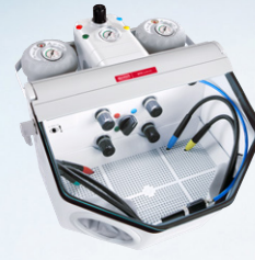
Basic quattro IS Micro-sabbatrice 25-70 µm/70-250 µm Art. No. 2959 0000