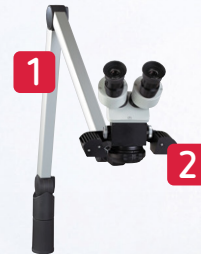
2 Lampada LED per Mobiloskop S Art. No. 2200 5000