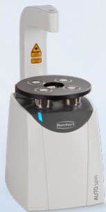
AUTO spin Foragessi Art. No. 1860 0000