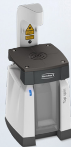
Top spin Foragessi Art. No. 1840 0000