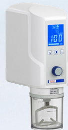
Twister Miscelatore sotto vuoto incl. tazza da 500 ml e agitatore Art. No. 1826 0000

(disponibile anche con disco abrasivo Klettfix)