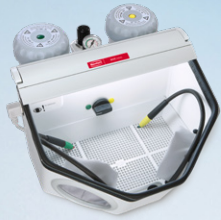
Basic classic Micro-sabbatrice 25-70 µm/70-250 µm Art. No. 2947 2025